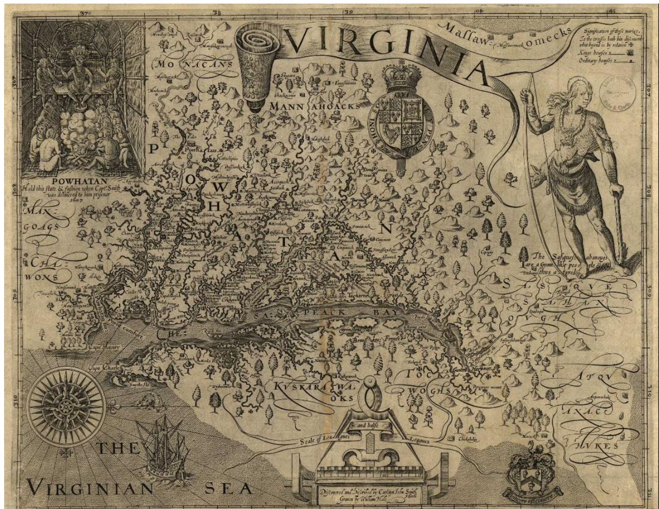
Fuente: National Park Service. (2022, 10 de febrero). John Smith's Map of Virginia: A Closer Look . Captain John Smith Chesapeake National Historic Trail. Disponible en: https://www.nps.gov/articles/000/smith-map-of-virginia.htm

“John Smith's A Map of Virginia: With a Description of the Country, the Commodities, People, Government and Religion.1612”